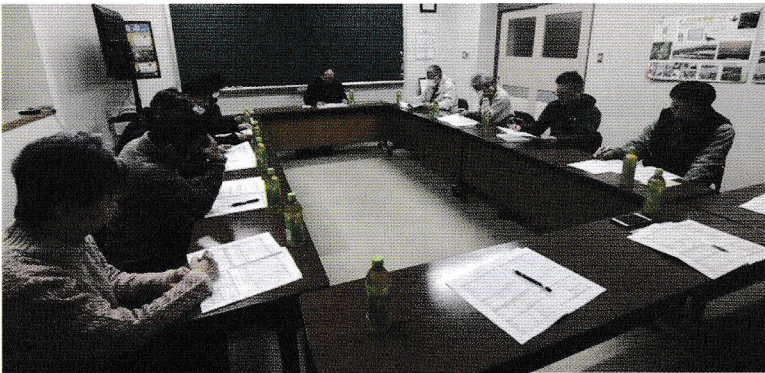
会議は、午後6時30分に開会します

今秋には、郵便料金の値上げがあり、また最近では配達遅れが目立つため、今後の事務連絡は、スマホのLINEで行うことが了承され早速「LINEグループ」を立ち上げました。